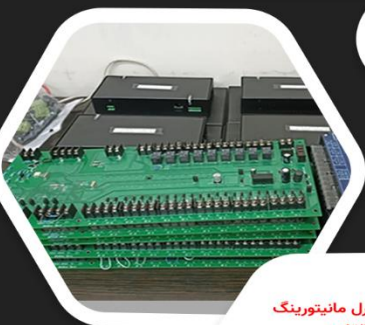
دیگرام سامانه کنترل مانیتورینگ کوره های القایی