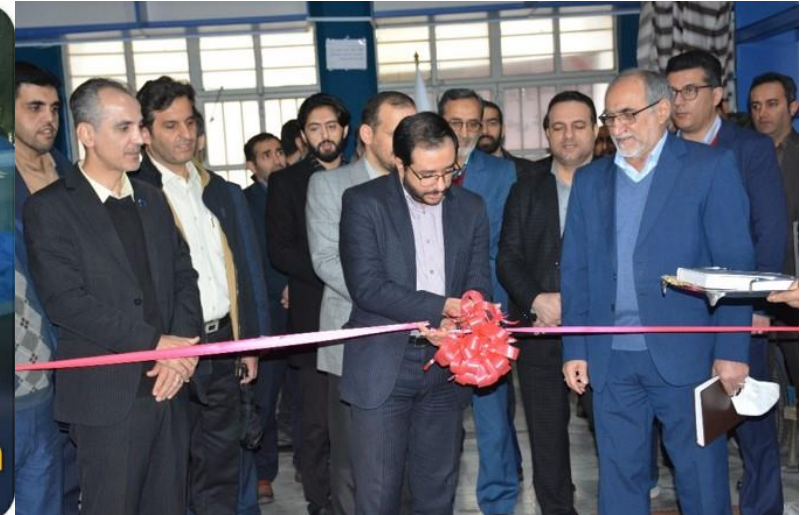
نمایشگاه فن بازار هفته پژوهش ۱۴۰۱