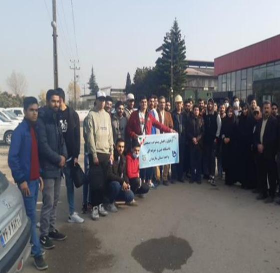
بازدید پیشرانان صنعتی از کارخانه فولاد طبرستان