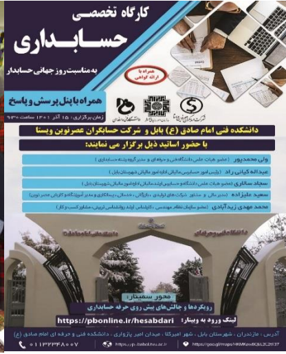
کارگاه علمی تخصصی