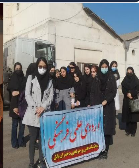
بازدید از کارخانه آرد