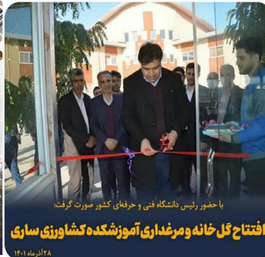
افتتاح گل خانه و مرغداری