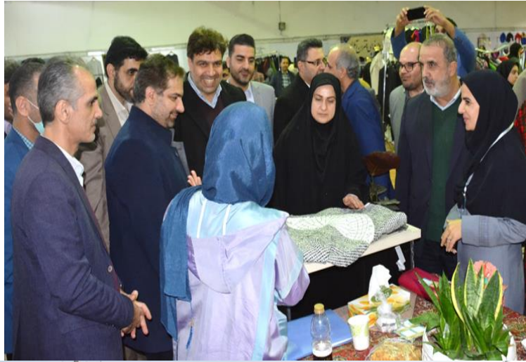
نمایشگاه پوشاک و صنایع دستی (چله شو)