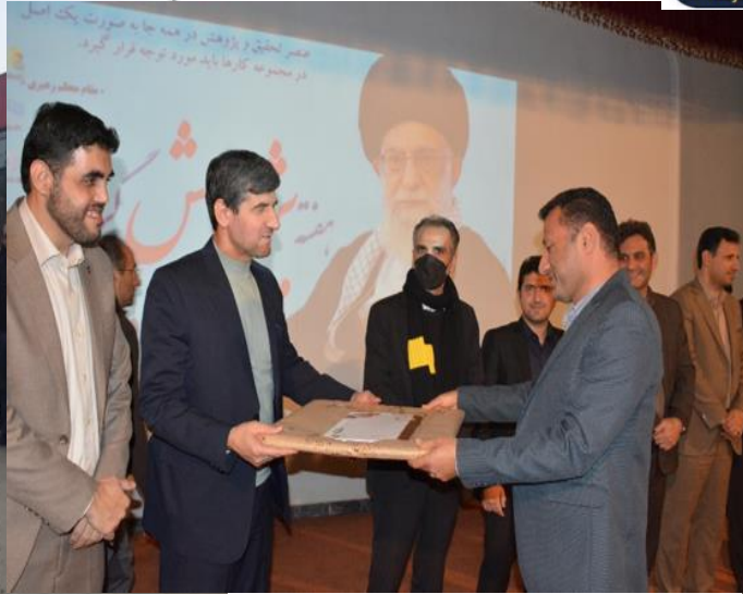
تقدیر از پژوهشگران برتر