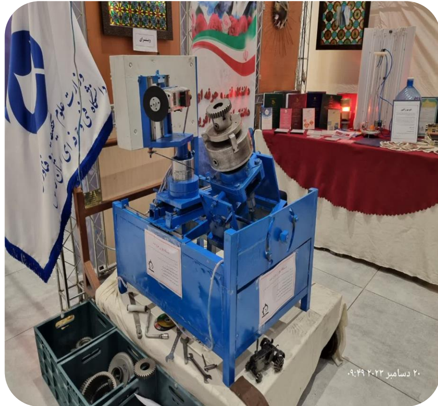
دستگاه پخ زن چرخ دنده