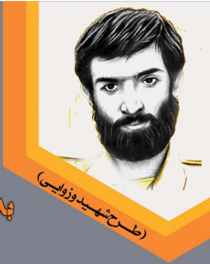
(طرح شهید وزوایی)