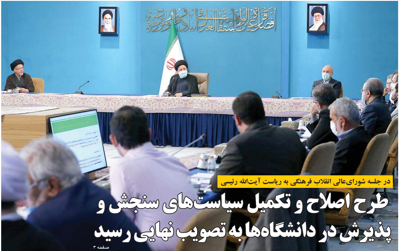
در جلسه شورای عالی انقلاب فرهنگی به ریاست آیت‌الله رئیسی

هفته‌نامه خبری و اطلاع‌رسانی سازمان سنجش آموزش کشور | دوشنبه ۲۳ خرداد ۱۴۰۱ | ۱۶ صفحه | شماره پیاپی ۱۲۷۹