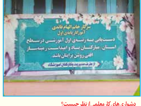
دشواری‌های کار معلمی از نظر چیست؟