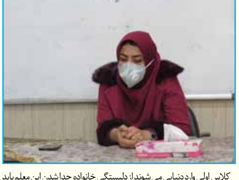
کلاس اولی وارد دنیایی می‌شوند از نلستگی خانواده جدا شدن این معلم باید به آن‌ها امنیت و آرامش بدهد. حالا در کنار این‌ها یک آموزش سخت هم در پی دارد، چراسخت؟ کلاسی اول پایه سخته هست چون بچه‌ها حروف الفبا را یاد می‌گیرند و در جاده سواد آموزی قرار می‌گیرند. خشت اول را معمار (معلم) باید به گونه‌ای خوب بچیند یعنی نه اینکه دانش آموز را توانمند کند بلکه باید ارزش کلمات را هم به او یاد دهد. یک معلم موفق باید احترام به مادر را در بچه‌ها نداند و باید که دانش آموز را با خود کوچک یا دوست به همکارانم توصیه می‌کنم هر کس وارد کلاس اول می‌شود، صبوری، مهربانی، قاطعیت، علم و روانشناسی همه را باید داشته باشد تا بتواند یک دانش آموز خوب تربیت کند.

دشواری‌های کار معلمی از نظر چیست؟ افراد مختلف از دشواری‌ها تعبیر متفاوتی دارند. یک مادر در دوران بارداری دشواری‌هایی تحمل می‌کند این را ما دشواری می‌بینیم ولی برای یک مادر شوق و عشق است و اصلاً دشواری نمی‌بیند؛ همه لحظه‌ها سراسر شیرینی است. یک معلم عاشق به کار، یک معلم توانمند دشواری کم دارد و آن دشواری نیز برای معلم شیرین است. سال قبل کرونا واقعه‌ای در دیدار معلم و دانش آموز به وجود آورد در پایان سال من یک صحبتی را در قالب دکلمه ارائه دادم. گفتیم: به خستگی‌هایم در هنگامه‌هایم ظهورم، هنوز زنده‌ام برایتان می‌تید. خیلی‌ها گفتند چه می‌گوییم؟ گفتیم: خستگی‌های یک معلم در ظهر هم مقدس است این را الان نمی‌خواهم شعار بدهم، معلمان می‌دانند که من چه می‌گویم. معلم کلاس اول ابتدایی در روز یک کلمه را بیست بار بخشد و چند بار آن کلمه را صدا بکشد تا دانش آموز را بخود همراه کند. قطعاً در پایان روز خستگی دارد ولی خستگی بس شیرین است.