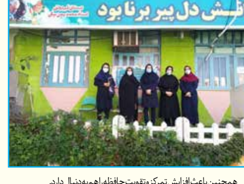
همچنین باعث افزایش تمرکز و تقویت حافظه را هم به دنبال دارد.