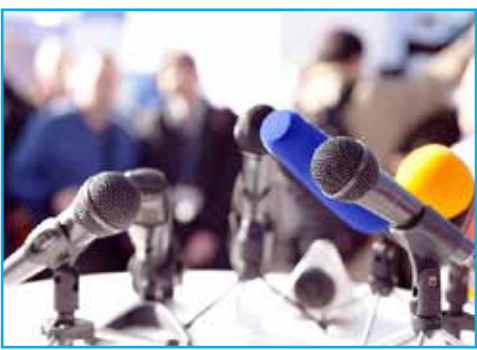
پیکری های مصرائه و اشرافیت لازم به امورات مختلف، نسبت به محقق شدن وعده های مسئولین و مطالبه های مردم، ایفای نقش کرده و زبان جامعه باشند.

اینکه سابقه ی تئاتر در ایران به چه موقع باز می گردد تاریخ دقیقی در دسترس نیست، ولی تئاترهای ایرانی پیوند عمیقی با واقعه کربلا و سایر وقایع و زندگی پیامبران دارد که عموماً تعزیه نامیده می شود. تئاتر جدید و مدرن اروپایی همچون بسیاری دیگر از مظاهر غربی در زمان ناصرالدین شاه به ایران آمد. تا قبل از سفرهای سه گانه شاه به اروپا، تئاتر غیره تعزیه ی ایران تنها به یک سری نمایش های سبک کوچک بازاری خلاصه میشد، روحی و تقلید کاری نمونه ای از آن بود. اشخاصی چون «شیخ شیپور»، «شیخ کرنا» و یا «کریم شیره ای» تئاترهای فی البداهه اجرا می کردند و خاطر شاه منسبط می گردید. ولی سفر شاه به اروپا و دیدن عظمت و شکوه ابراهام و سالن های نمایشی آنجا دل شاه را برد. وی که شيفته ظاهر سازی بود و قبل از آن «تکیه دولت» را برای