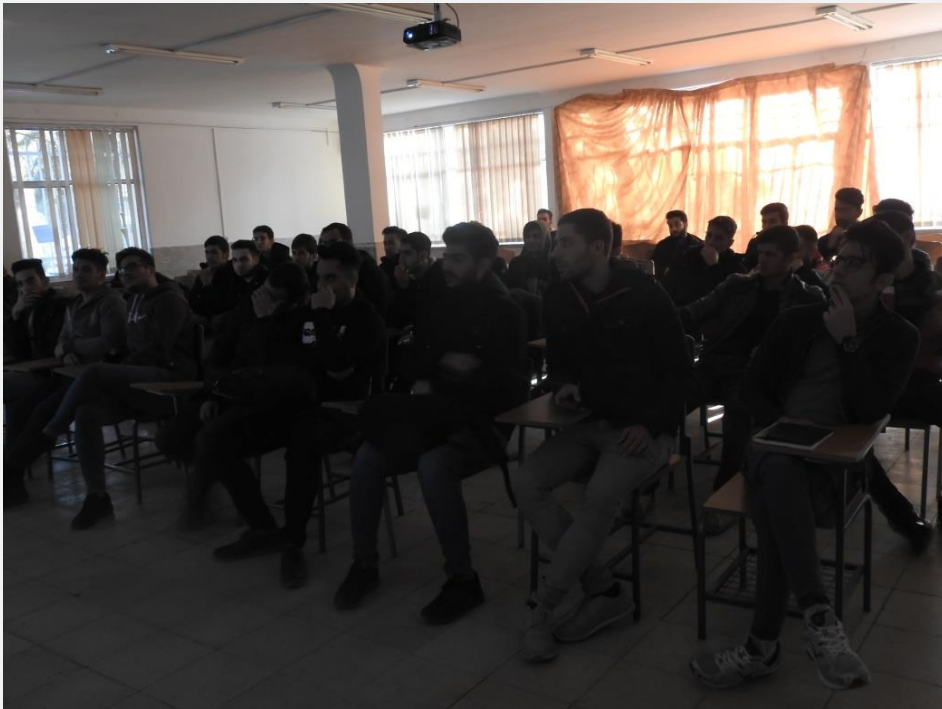
برگزاری کارگاه آشنایی با سازه های ساندویچی در مکانیک (۱۳۹۸/۹/۴)