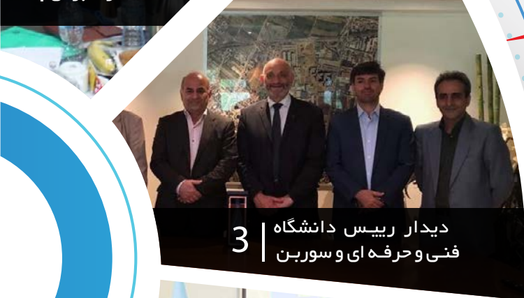
3 | دیدار رییس دانشگاه فنی و حرفه ای و سوربن