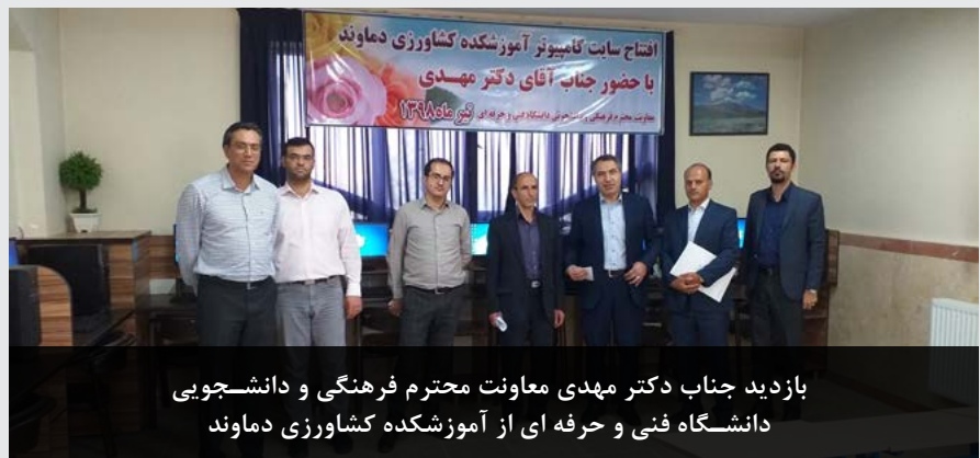
بازدید جناب دکتر مهدی معاونت محترم فرهنگی و دانشجویی دانشگاه فنی و حرفه‌ای از آموزشکده کشاورزی دماوند

شایان ذکر است که در این دیدار سایت کامپیوتر آموزشکده کشاورزی دماوند نیز افتتاح گردید.