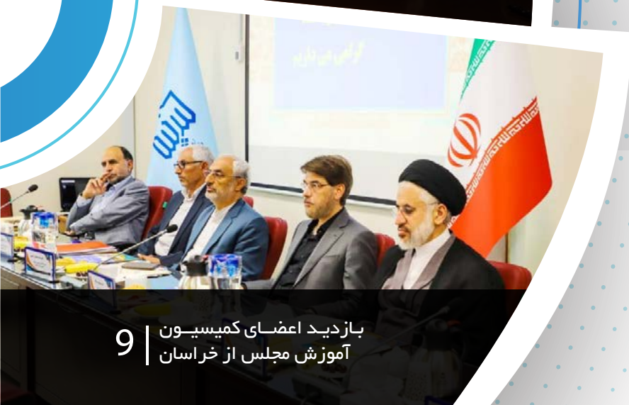
9 | بازدید اعضای کمیسیون آموزش مجلس از خراسان