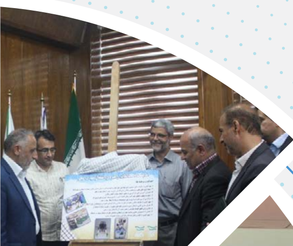
4 | راه اندازی اندیشکده مطالعات راهبردی