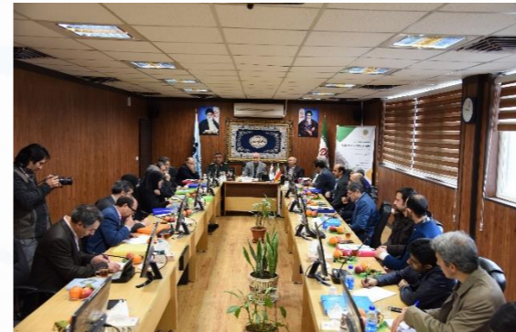
مهارتی قبل از خدمت سربازی دارند.

سردار فرحی در خاتمه سخنان خود پیوستگی ارکان اصلی این طرح ۱- دانشگاه فنی و حرفه‌ای و دانشگاه جامع علمی کاربردی ۲- شاخه فنی و حرفه‌ای وزارت آموزش و پرورش ۳- سازمان فنی و حرفه‌ای را در اثربخشی این طرح و در راستای تربیت جوانان کارآفرین و خلاق در مسیر اشتغال‌زایی و در نهایت توسعه را ضروری دانست.