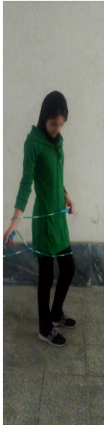
الف - مانتو و شلوار ورزشی