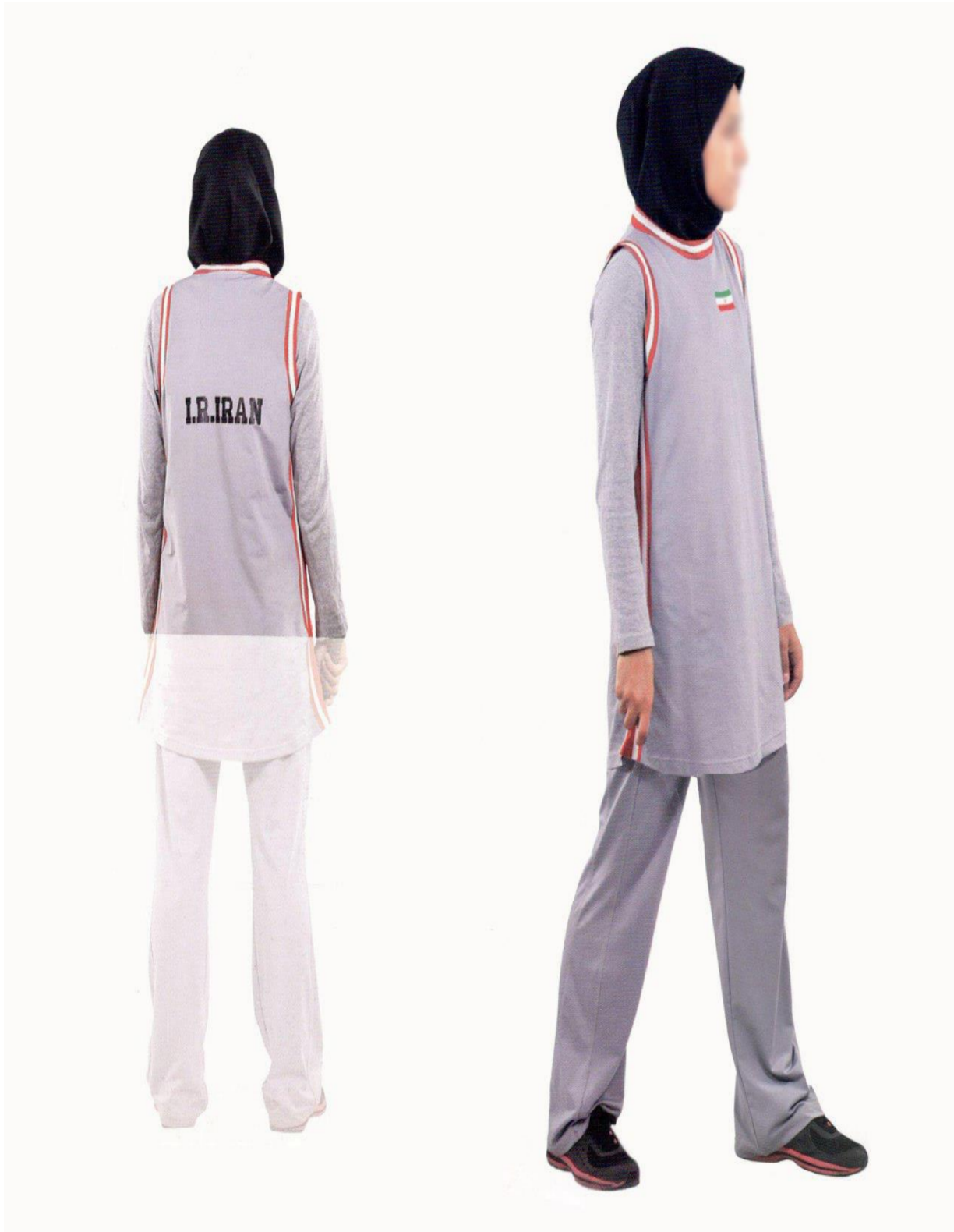
ب - سارافون و شلوار ورزشی